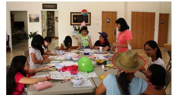
21-23/06/2012-Thánh Kinh Mùa Hè: các em học Thánh Kinh, học hát, làm thủ công...