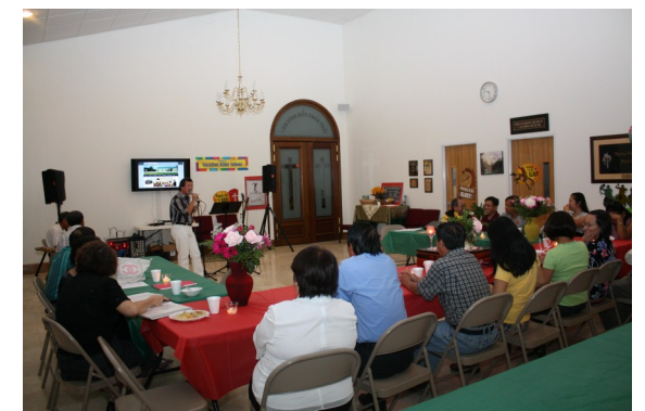
23/06/2012 - Điểm Hẹn: Buổi họp mặt, ca hát thân mật cho các bạn hữu Hội thánh.