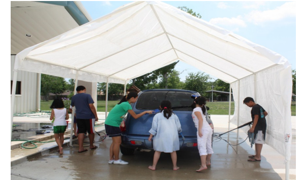
17/06/2012 - Lễ Thân Phụ - Father's Day: các em thiếu niên rửa xe cho các cha mẹ.